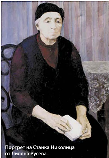
Портрет на Станка Николица от Лиляна Русева

„Коя е тая млада и чудна жена – Станка Николица, смела будителка, вдъхновена и бодра апостолка на женското движение във време на робство, на ужаси, на нещастия и беда?