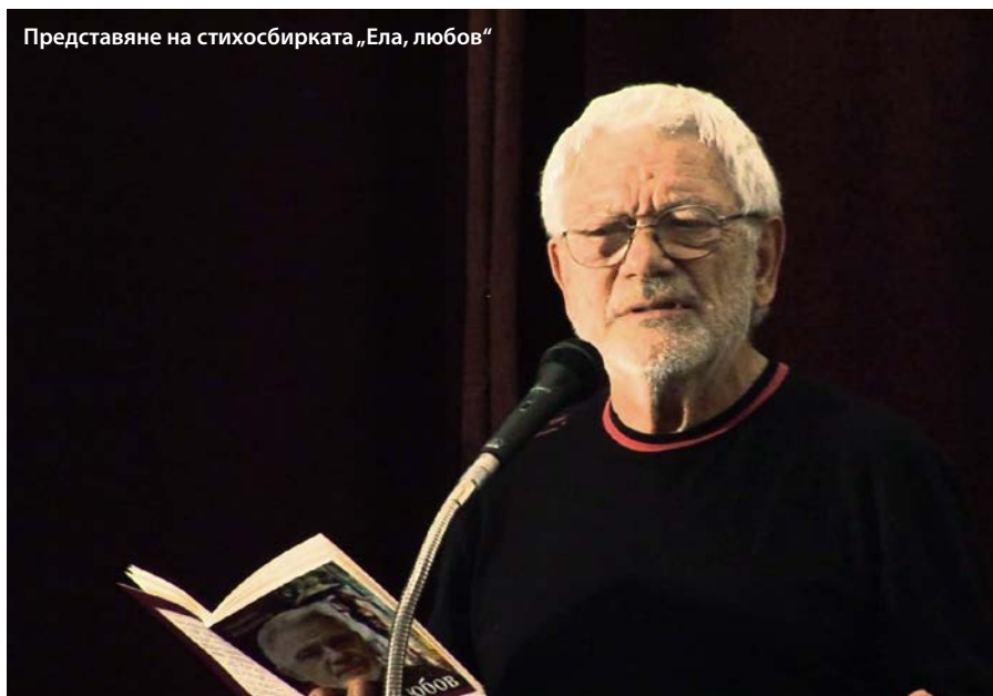
Представяне на стихосбирката „Ела, любов“