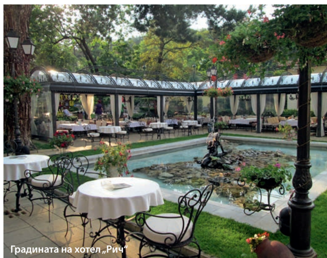
Градината на хотел „Рич“