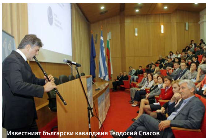
Известният български кавалджия Теодосий Спасов