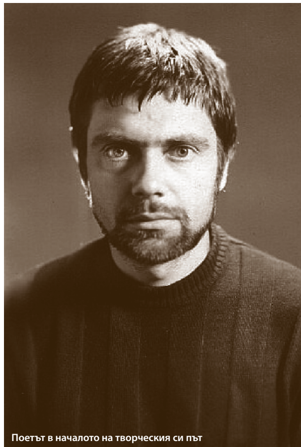
Поетът в началото на творческия си път

И ако сред многобройните му стихосбирки – над 30 на брой между „Всичко ще изпита-ме“ (1963) „Танц“ (2010) „70 Стихотворения“ (2010) и „Безлюбовие“ (2012) има и конюнктурни, повърхностни и злободневни експромти (все пак аз много харесвам ретроатмосферата на „Старомодна поезия“ от 2002 г.), то той може да бъде спокоен, че с любовната си и интимно – изповедна лирика, ще остане в сърцата на своите читатели. Няма да е пресилено, ако се посочи, че творби като „Не остарявай, любов“, „Младостта си отива“, „Молитва за България“, „Остаряваме бавно“, „Моето мъжко момиче“, или „Любов необяснима“ ще намират винаги място във всяка уважаваща се антология на българската поезия, където аз бих поставил и ярко нестандартната му „Песничка за Червената шапчица“, с която, преосмисляйки