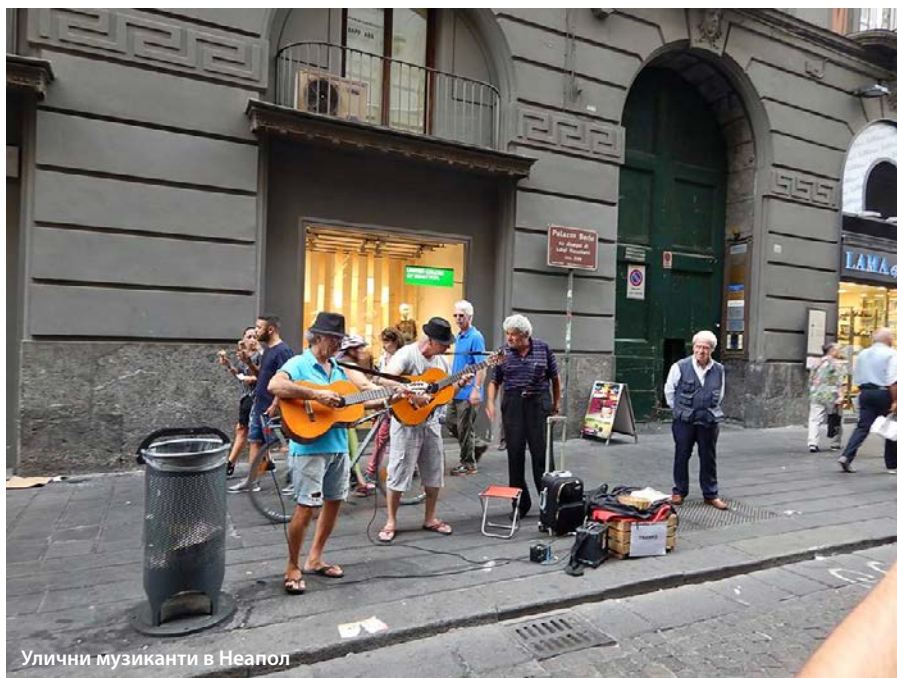
Улични музиканти в Неапол

колите – петдесетина яки веселяци по тениски, шарени ризи с къси или навити ръкави, златни ланци, татуировки и лъскави, гъсти, черни, добре сресани перчемички викат: „Паоло, Роберто, бонджорно, рагаци, тути-фрути“ и т.н. и т.н. После насред разговорите, се появява набит мъж на средна възраст, в сив, поомачкан костюм, с жълта вратовръзка с голям възел; той приближава спокойно, много уверено, леко усмихнат, а в очита му също трептят закачливи, дръзки, но и властни пламъчета. При появата му групата таксиметрови веселяци притихва в почтително мълчание, смеховете секват, главите се свеждат покорно. Мъжът със сивия костюм ги приближава, заговаря, те сдържано кимат, бонджорно, бонджорно. Кой ли е този, можете само да гадаете, после така или иначе, той се отдалечава, а щом се скрива зад ъгъла, смеховете се възстановяват. Пълно е и с джебчийки от малцинствата, просяци, клошари; наконтени карабинери с вид на модели на Версаче. По улиците на Неапол се крещи, но и пее, майките понякога шамаросват децата си, от балконите висят пъстроцветни гащи и чаршафи, а престъпниците, по всичко личи, си имат свой град. Изобщо Неапол си е като някакъв близък, да кажем тре-