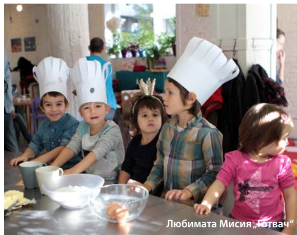
Любимата Мисия „Готвач“