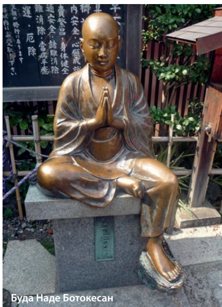
Буда Наде Ботокесан

Уено е моя традиционна спирка в Токио. Тук се намира най-старият парк на града с много музеи и с най-известната концертна зала в Токио, в която винаги имаме по няколко представления. Тя е построена през 1961 г. и за времето си е била най-голямата концертна зала на столицата, проектирана от Кунио Маекава. В Уено е разположен и Националният музей на Токио с над 86 000 произведения на будисткото изкуство и занаяти, Националният