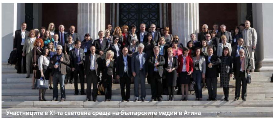
Участниците в XI-та световна среща на българските медии в Атина

Единадесетата медийна среща на български журналисти от България и света бе открита на 4 ноември 2015 г. в Националния университет на Атина с кратко слово на генералния директор на БТА Максим Минчев, който поздрави участниците в срещата – журналисти от 21 български медии от три континента. Няколко думи към журналистите отправи и председателят на парламентарната комисия по култура и медии Полина Карастоянова. Приветствено слово произнесе и българският посланик в Гърция Емилия Кралева, която поздрави и гръцките домакини на срещата. Откриването завърши с изпълнение на музикалния виртуоз Теодосий Спасов.