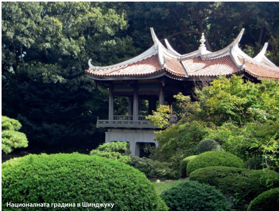
Националната градина в Шинджуку

музей на западното изкуство, светилища и храмове, както и най-старата зоологическа градина с над 2600 животни.