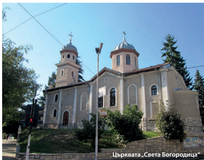
Църквата „Света Богородица“

Потегляйки от София, след около два часа път, пристигаме във Велинград. Градът се намира в западната част на Чепинската котловина, заобиколен от великолепни борови гори. Извиращите в града минерални извори са били известни още от древността, когато по тези места е живяло тракийското племе беси, а тракийският певец Орфей е пеел своите омайни песни. Твърди се, че по времето на българския цар Петър II Делян българските боляри идвали тук, за да се потопят в лечебните води за