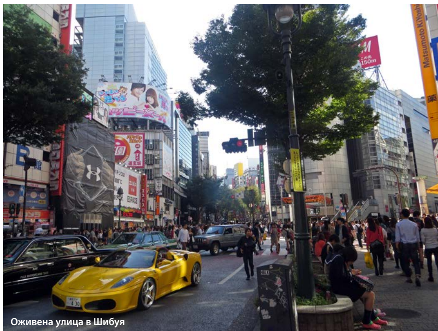
Оживена улица в Шибую

В електрония град Акихабара отново се чувствам като на друга планета. Тук можете да си купите каквато електроника си пожелаете, защото ежеседмично се появяват все нови и нови стоки – все последна дума на техниката. Закупуването на мишка за компютър ми отнема два-три часа.