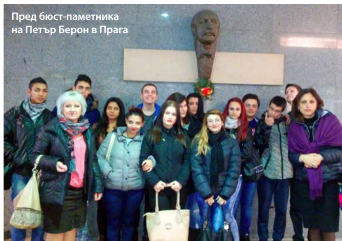
Пред бюст-паметника на Петър Берон в Прага