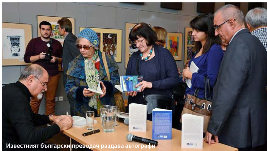
Известният български преводач раздава автографи