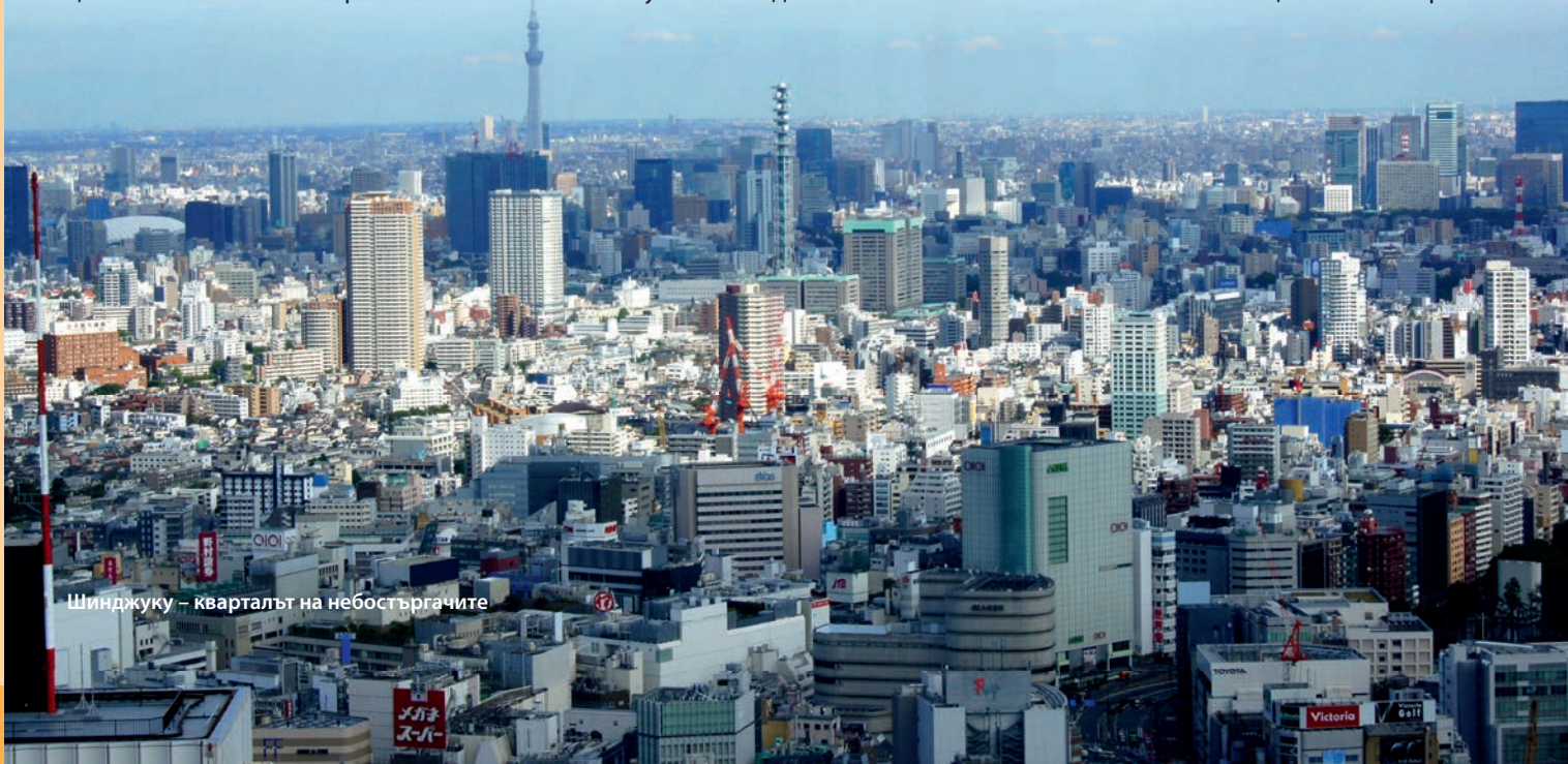
Шинджуку – кварталът на небостъргачите

Shinjuku Gyoen има европейска и японска част. Площта около езеро-