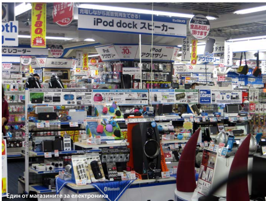
Един от магазините за електроника

В един от магазините на няколко рафта са разположени всякакви подобия на компютърни мишки – вкл. и такива с миши опашки, така че избирането на една от тях се превръща в приключение – всичките цветове, форми и размери започват да се сливат пред очите ми. Най-накрая грабвам една мишка, взимам пълом лилава четка за почистване клавиатурата на компютъра заедно с анатомична червена подложка за ръката. В златната електронна мина, наречена Акихабара, намирам и желаните адаптер и конектор за моя