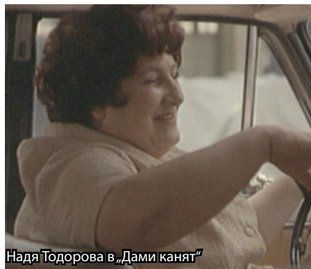
Надя Тодорова в „Дами канят“

На 21 юни 2016 г. в Прага почина известната българска артистка Надя Тодорова.