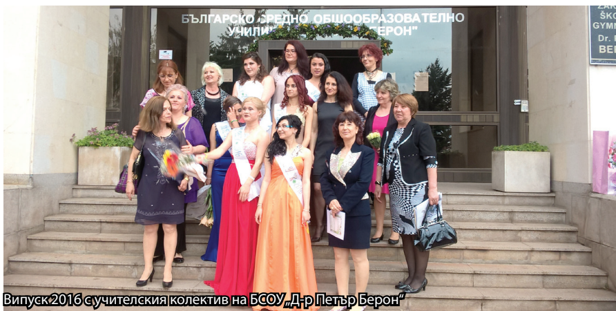
Випуск 2016 с учителския колектив на БСОУ „Д-р Петър Берон“

24 май е възторжен и паметен ден – празничен, светъл, неповторим! Ден, на който с дълбок поклон бележим духовния подвиг на нашите първоучители - светите братя Кирил и Методий. Това е денят на славянската писменост, на силата и волята на българския народ да пази език и култура.