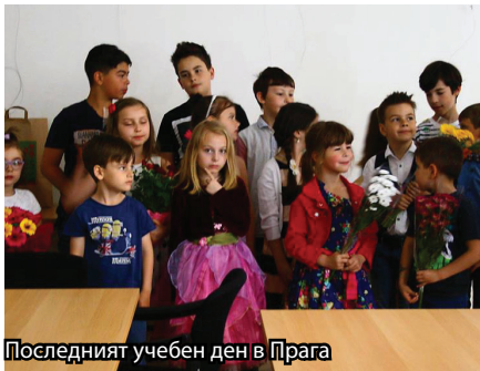
Последният учебен ден в Прага

Последният учебен ден беше изпълнен с много вълнение и празнично настроение за учениците, учителите и родителите от Съботно-неделно училище „Възраждане“. В ранната неделна утрин на 5 юни учениците от първи, втори и трети клас дойдоха, заедно с родителите си, в Дома на националните общности, за да участват в тържеството по случай края на учебната година. Много радост,