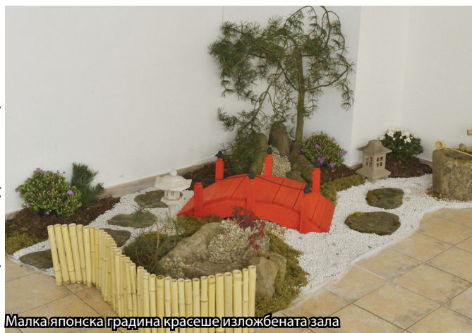
Малка японска градина красеше изложбената зала