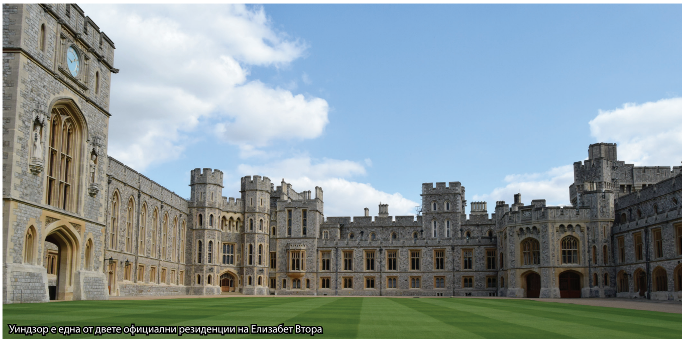
Уиндзор е една от двете официални резиденции на Елизабет Втора

Най-големият функциониращ кралски дворец в света е този в Уиндзор, графство Бъркшир, Англия. Жилищната резиденция на кралицата на Великобритания се намира само на 34 км. западно от столицата на Обединеното кралство.