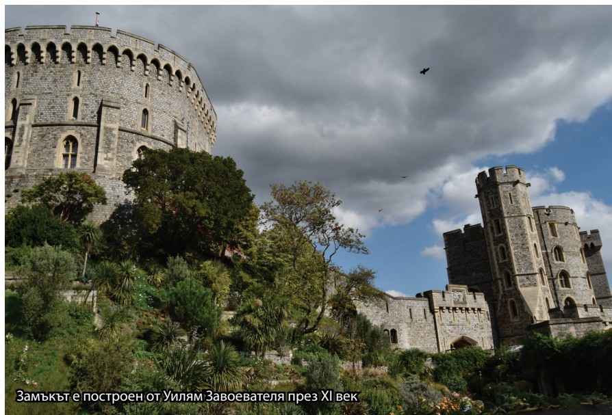
Замъкът е построен от Уилям Завоевателя през XI век

не предназначения – служили за кралска резиденция, в тях е имало много приеми, използвани са за съд и дори за затвор за кралски особи. През замъка са минали осем последователни кралски династии и се празнуват сватбите на кралското семейство от 12 век до днес. Залите са украсени с богати картини от кралската колекция, отразяващи различни периоди от историята на Великобритания. Интериорите на двореца изкусно прелитат детайли от тежкия бароков стил, елементи от рококо и елегантна готика. По време на обиколката не пропуснахме да надникнем и в кухнята на кралицата, която е отворена за посещение само в определени периоди от годината. Под целия комплекс е изграден таен тунел, който извежда обитателите му при опасност. Погледът на любопитния турист няма как да не бъде привлечен в Долния вътрешен двор от „перлата на короната“ - параклисът „Сейнт Джордж“, който се откроява с изключителната си архитектура в духа на т.нар. перпендикулярна готика. В него са погребани 10 английски монарси. Там е и подземната гробница на Хенри VIII и неговата трета съпруга Джейн Сиймур. Не убягват от погледа и стъклописите на западния прозорец, които изобразяват 75 сюжета от английската история. В този параклис се провеждат церемониите, свързани с Ордена на Жартиерата, когато кралицата приема новите членове в най-стария орден