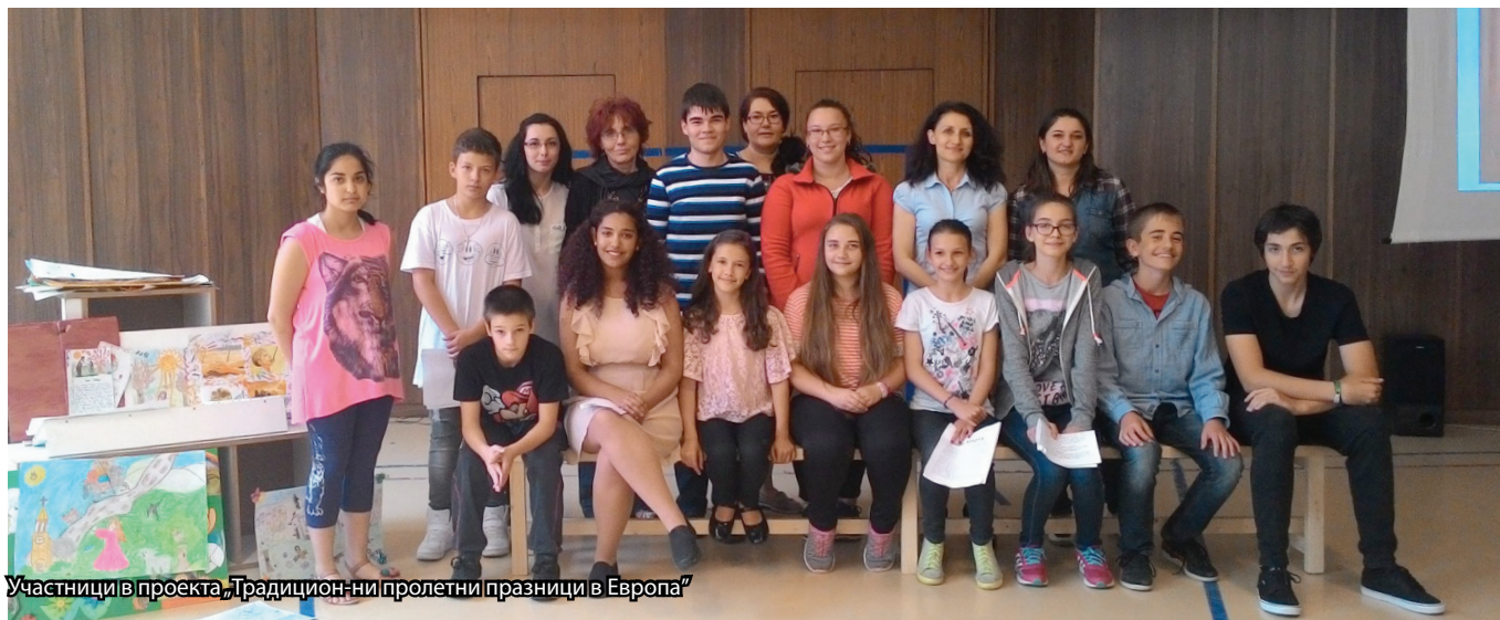
Участници в проекта „Традиционни пролетни празници в Европа“

На 13.06.2016 год. в БСОУ „Д-р П. Берон“ се проведе финалното представяне на творбите на всички участници в проекта „Традиционни пролетни празници в Европа“ от програмата Еразъм+, която се осъществи съвместно с Българското училище „Азбука“ в Дъблин, Българското училище за роден език в Будапеща и Българското училище „Кирил и Методий“ в Париж. В продължение на две години таланти деца с желание и жив интерес към пролетните празници в България и Чехия участваха в проведените три конкурса за създаване на есе, стихотворение, съчинение, рисунка, компютърна презентация и др. Авторите на най-сполучливите творби бяха наградени с пътуване до Париж, Дъблин и Будапеща, където имаха възможност да представят своите творения на децата от другите български училища в Европа. Днес те споделиха оригиналните си реализирани идеи пред останалите ученици от БСОУ.