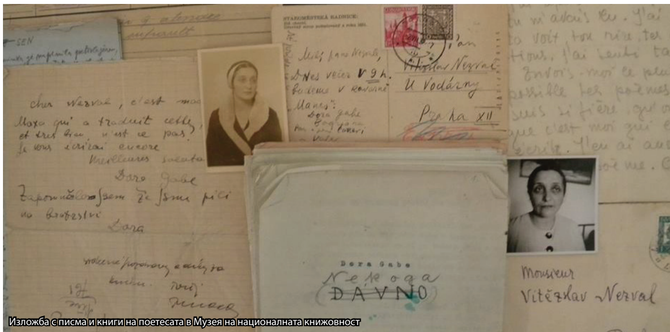
Изложба с писма и книги на поетесата в Музея на националната книжовност

посветени на съвременната българска литература, на „женския въпрос“, на събитията в България през 1925 г. събират многобройна публика. Тя е в разцвета на професионалната си кариера, млада, красива, привлекателна... Пребиваването в Прага ѝ носи нови запознанства с представители на чешката интелигенция. Именно тогава тя се запознава с Витезслав Незвал във Виноградския театър. Следва екскурзия в Кутна Хора. Пламналата между тях искра прераства в интелектуална и емоционална връзка.