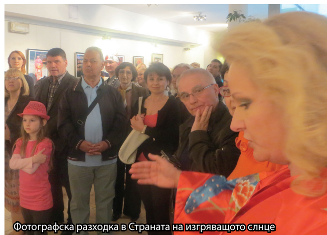
Фотографска разходка в Страната на изгряващото слънце