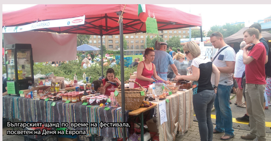
Българският щанд по време на фестивала, посветен на Деня на Европа

Денят на Европа беше традиционно отбелязан с фестивал под открито небе на 5 май 2016 г. на Стржелецки остров в Прага. Организатори на събитието са Европейската комисия, Европейският съюз - Фондът за сближаване и Операционната система за техническа помощ, Европейският парламент, Правителството на Чешката република и Министерството на