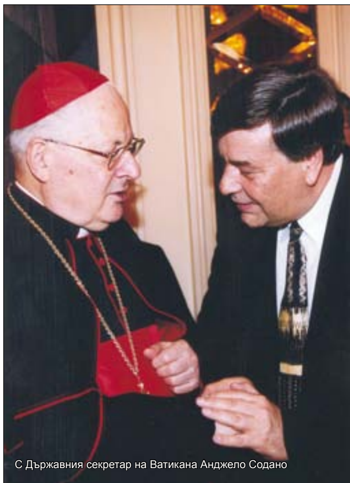
С Държавния секретар на Ватикана Анджело Содано