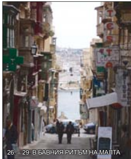
26. – 29. В БАВНИЯ РИТЪМ НА МАЛТА

18. – 19. IN MEMORIAM: ЗА ИЛИЯ ПЕНЕВ (1933 - 2006) – С УСМИВКА