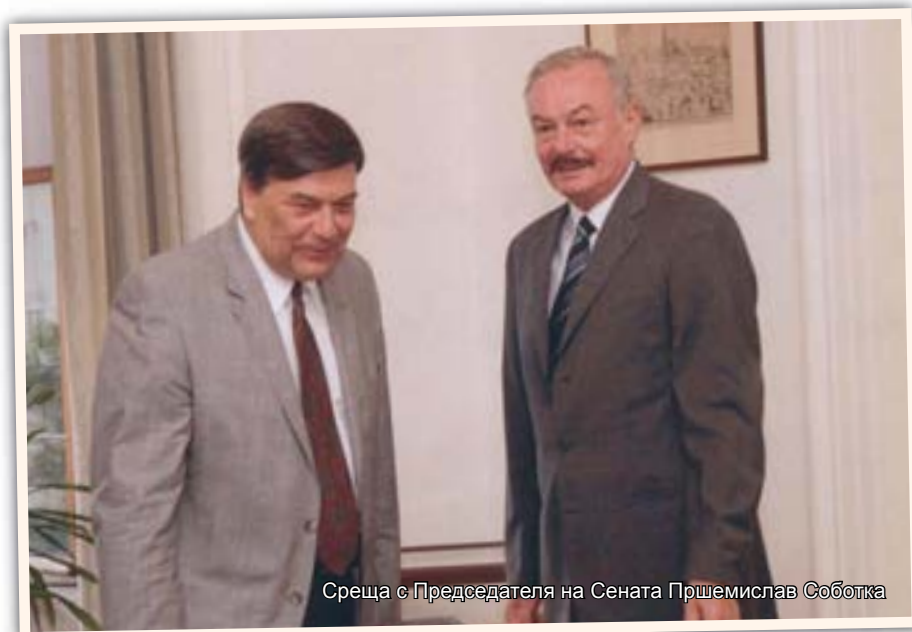
Среща с Председателя на Сената Прштемислав Сobotка