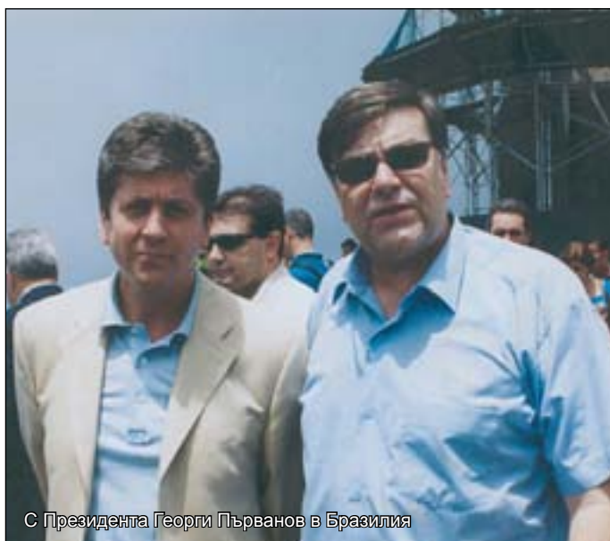
С Президента Георги Първанов в Бразилия

Ние трябва да информираме нашите сънародници максимално относно това, което става в България във всички възможни сфери – политически, културни, икономически, граждански. Освен това, трябва да повишаваме постоянно и качеството на консулските услуги, още