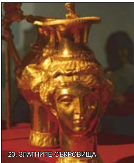
23. ЗЛАТНИТЕ СЪКРОВИЩА