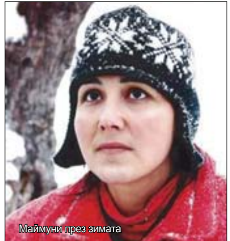
Маймуни през зимата