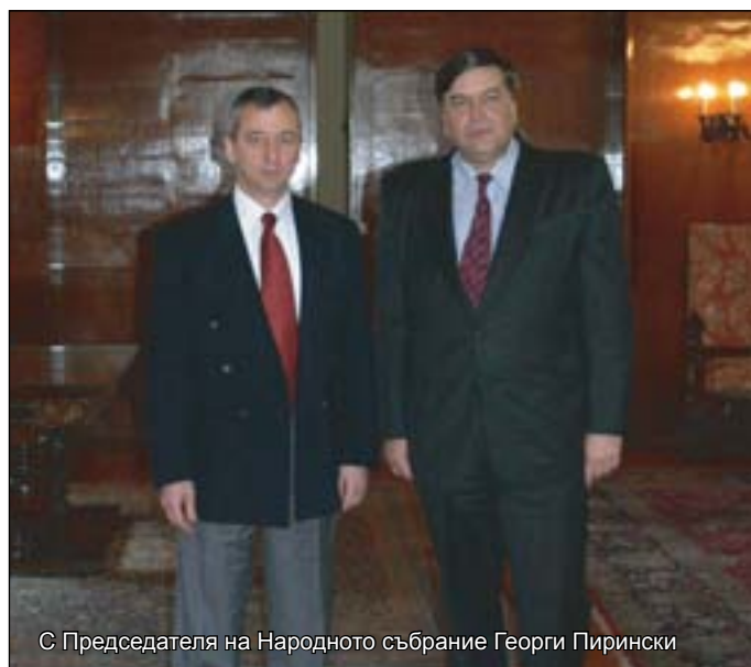
С Председателя на Народното събрание Георги Пирински