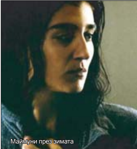
Маймуни през зимата