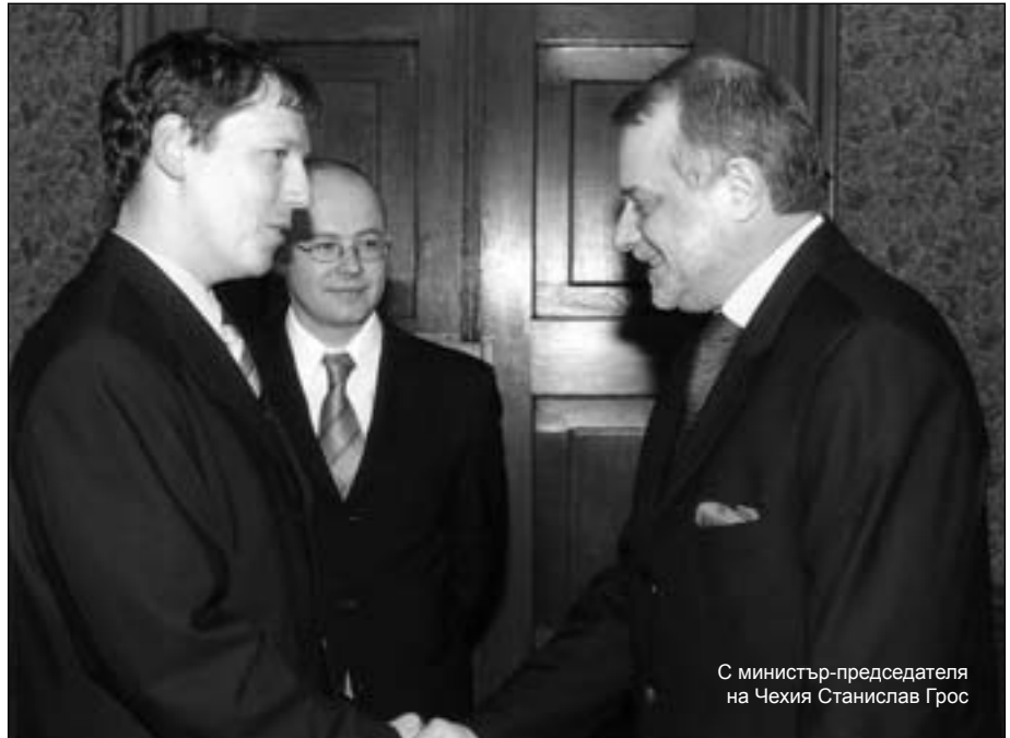
С министър-председателя на Чехия Станислав Грос

Веднага искам да кажа, че има и български инвестиции в Чехия. В Моравия има една т. нар. българска фабрика, има доста фирми със смесен капитал - най-вече