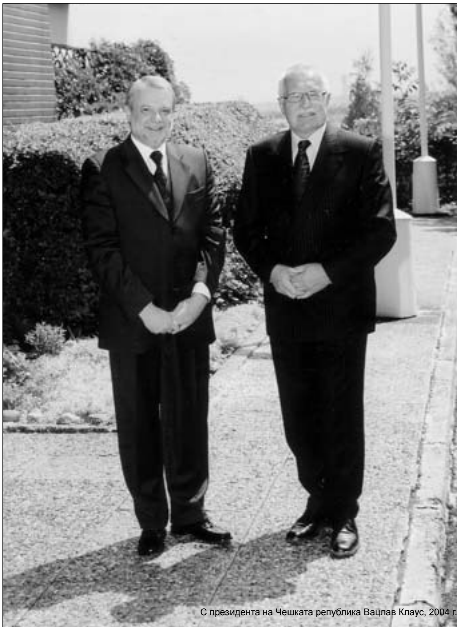
С президента на Чешката република Вацлав Клаус, 2004 г.

Чешката политическа сцена е много интересна и всички разговори с тези политици имат своята стойност. Аз имам не само близки познания, но и лични приятелства с хора от политическия елит в Чехия. Бившият президент Хавел е един изключително харизматичен човек и всеки разговор с него е едно обогатяване. Говорили сме на различни теми – за предишните режими, за детството му, за театъра и т.н.